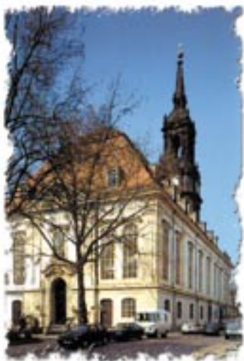
Dresden Dreikönigskirche Haus der Kirche

und zur Jubiläumsfeier 100 Jahre Blaues Kreuz Dresden